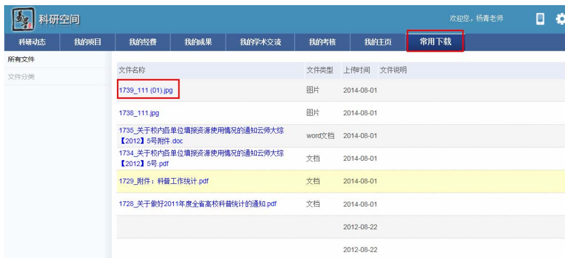
<文件下载管理示意图>