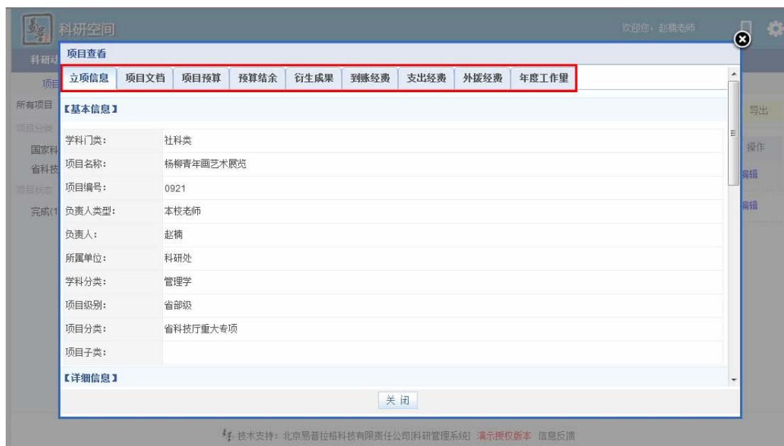
<项目其他信息编辑示意图>