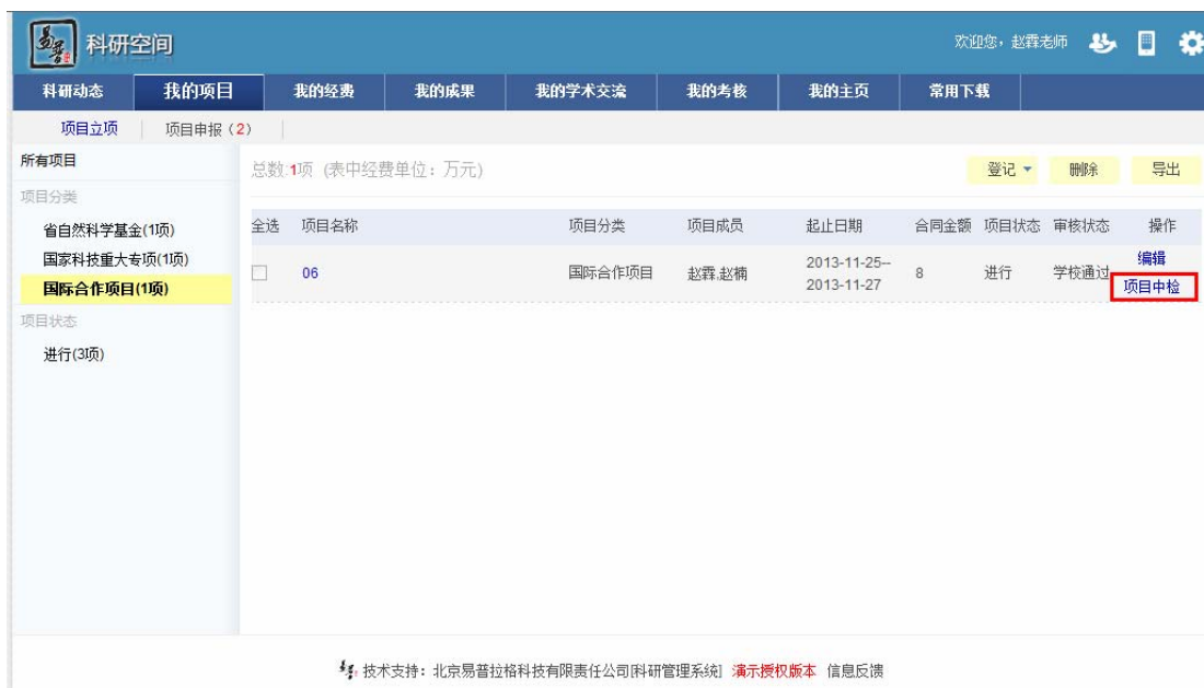
<提交中检材料示意图>