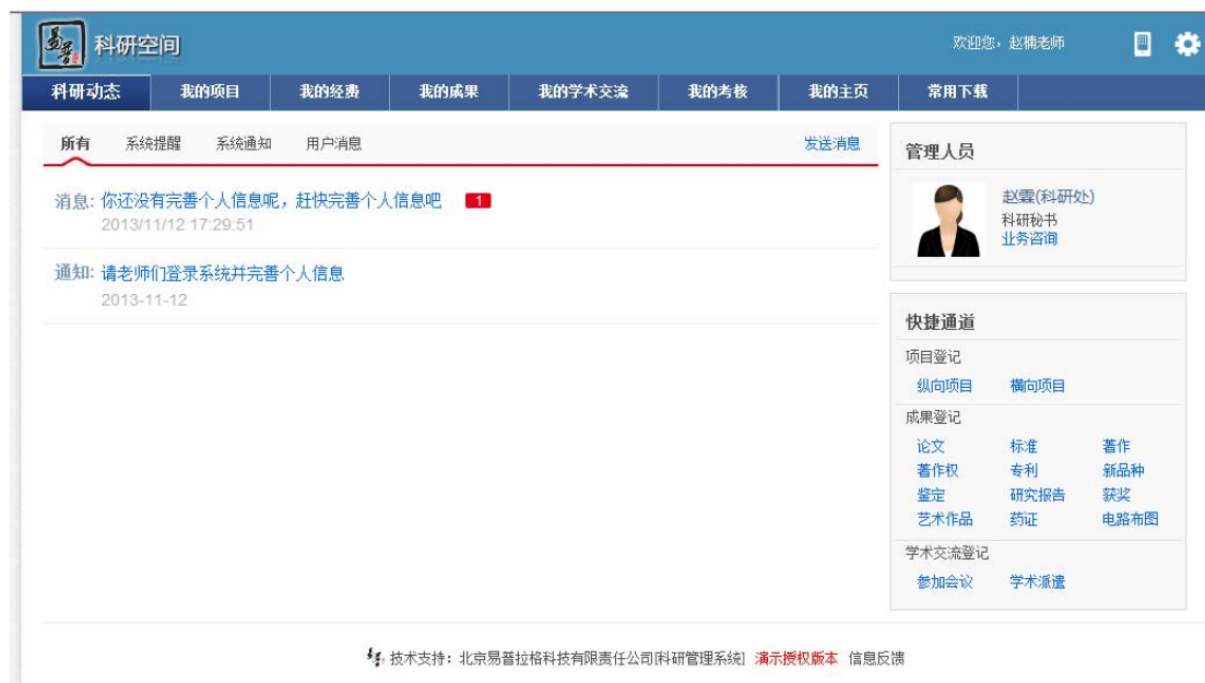
<系统首页页面示意图>

下图是登陆系统后首页面：包括主功能菜单区、消息公告提示区、管理人员展示区、快捷通道区及系统基本信息设置区。