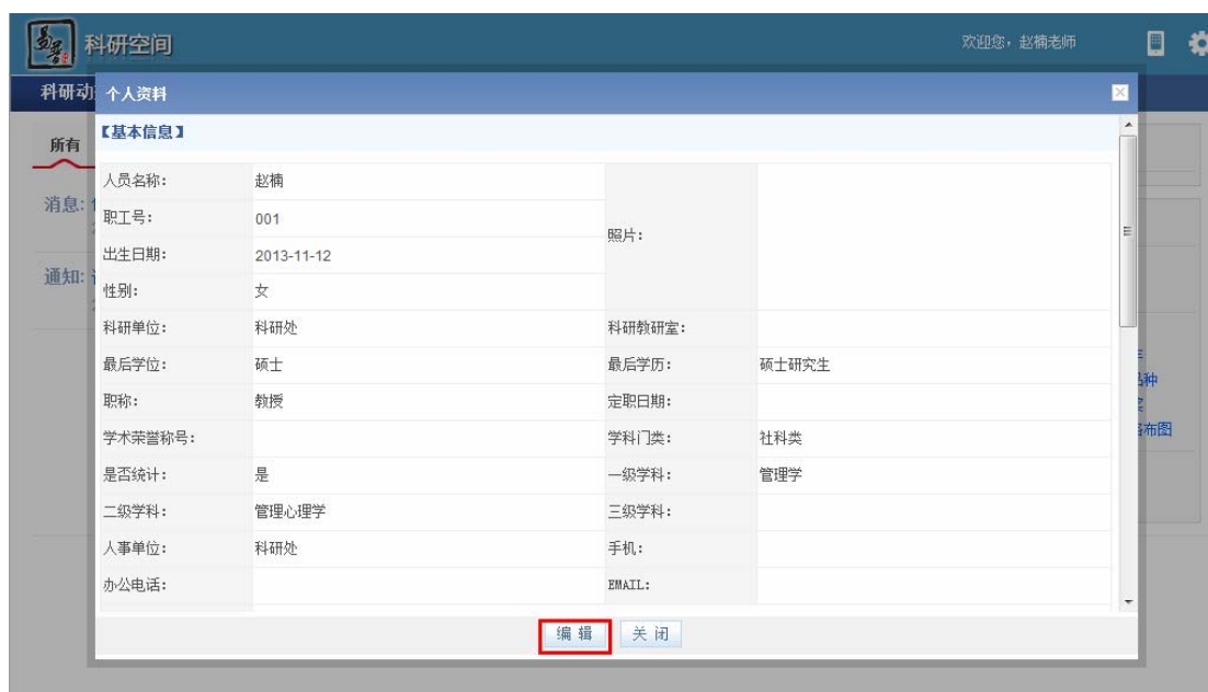
<个人信息编辑示意图 2>