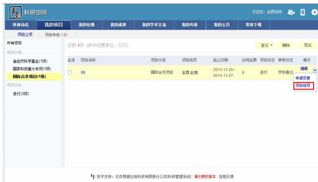
<提交结项材料示意图>