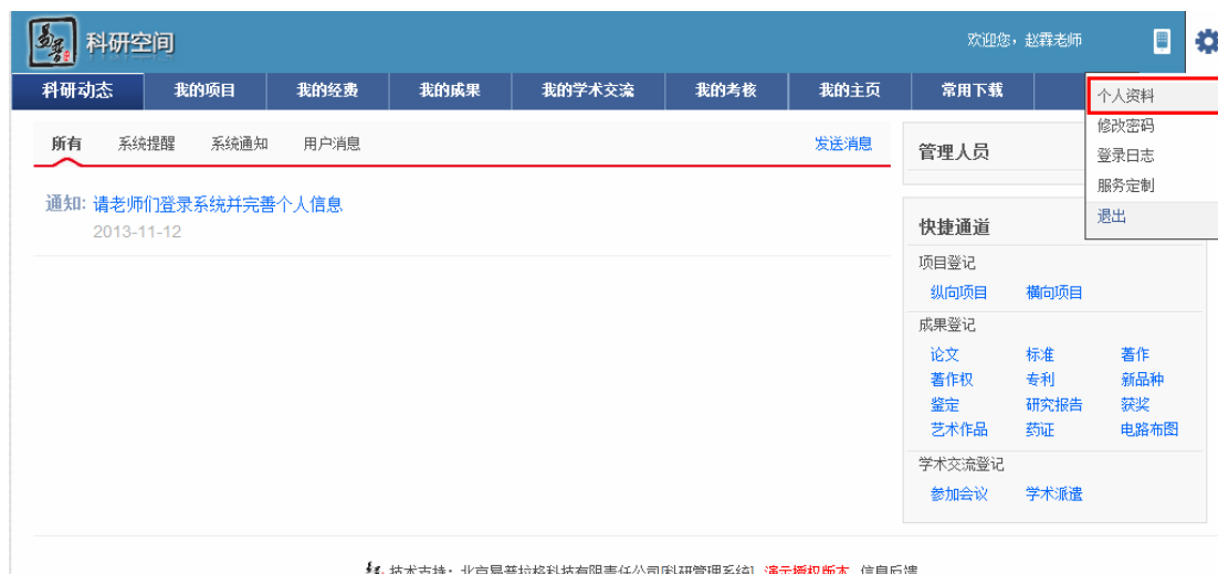
<个人信息编辑示意图 1>